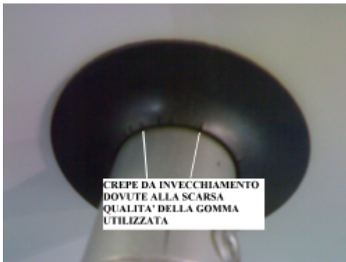
SPEWS FROM AGING DUE TO LOW QUALITY OF THE RUBBER USED

DO YOU HAVE ANY PROBLEM WITH THE SEALS ON THE BATTERY TUBES? WE HAVE THE SOLUTION !